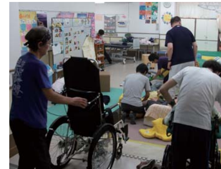
さあ、防災頭巾や車いすの準備だ

事前予告なし、抜き打ちの緊急放送による地震と火災による避難指示から施設の避難場所（中庭）までの避難時間は、グループ別に最短で5分、最長で8分かかりました。これで実際の災害時に大丈夫かな…?