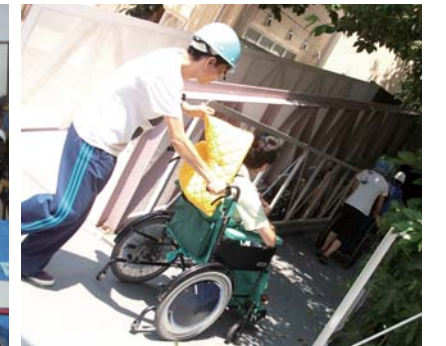
さあ、1台づつスロープで移動開始!