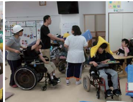
介助者の人数は足りるかな?